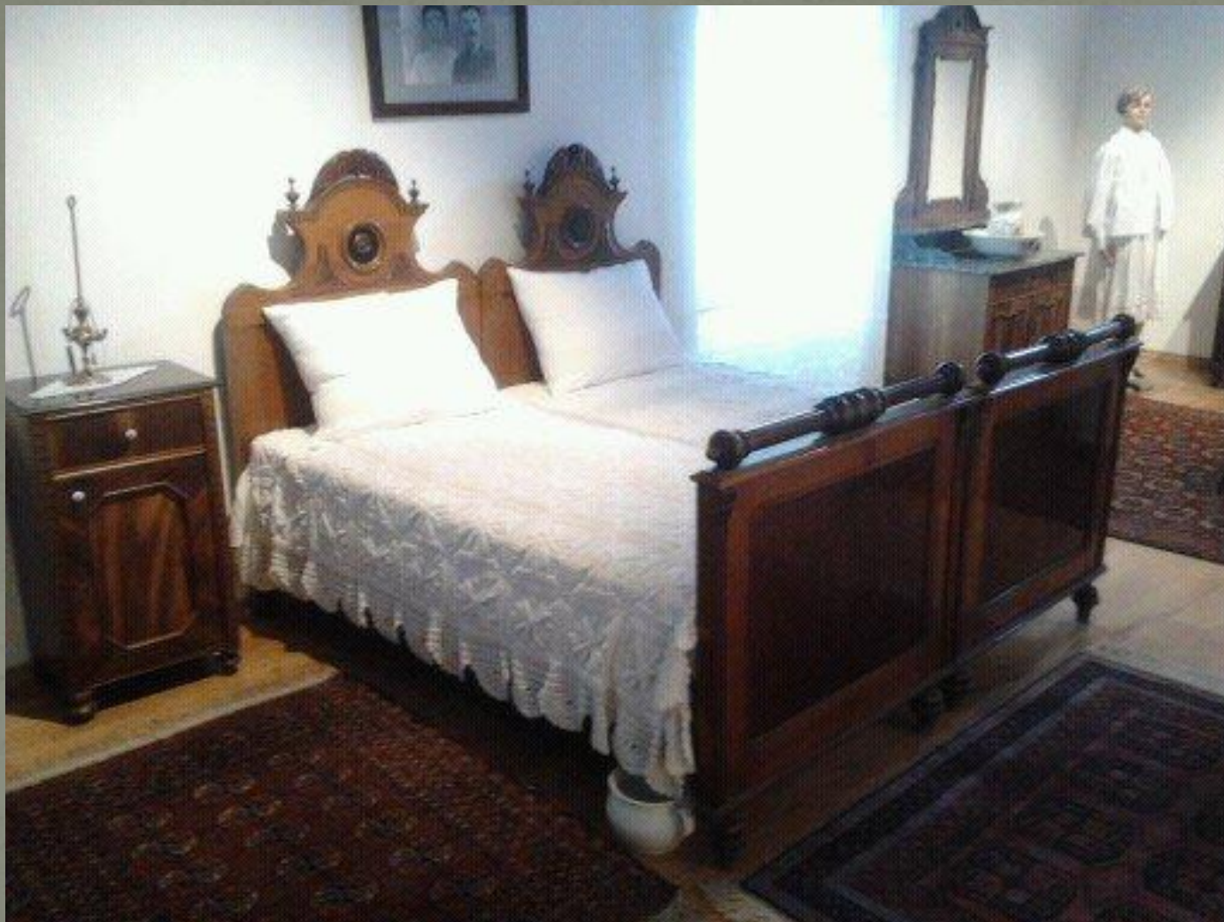
Soba iz Etnografskog muzeja u Splitu